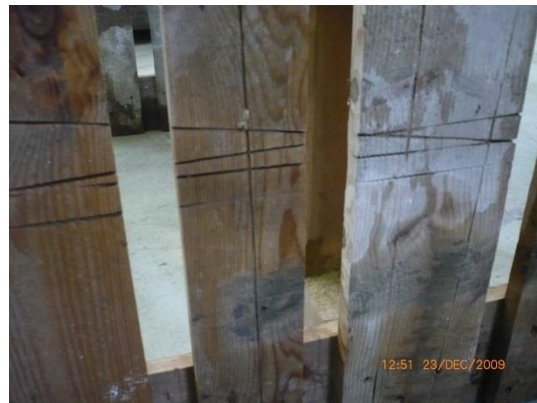
4.3.2 KÉP: Vágás nyomai a raklapon