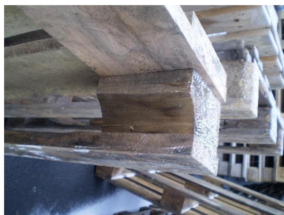
2.1.2 KÉP: Sérült tőkés (szálkamentes sérülés)