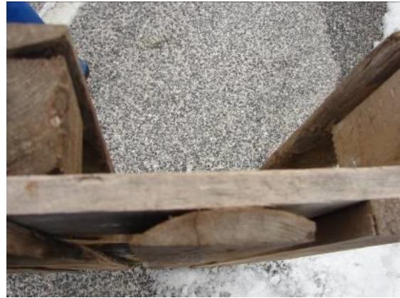
4.3.1 KÉP: Széldeszka