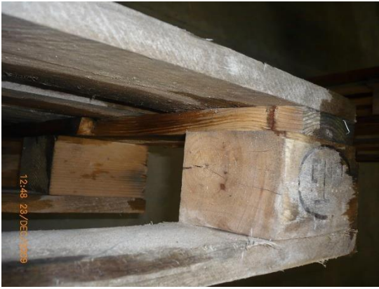
3.1 KÉP: Sérült fedlap-összekötő