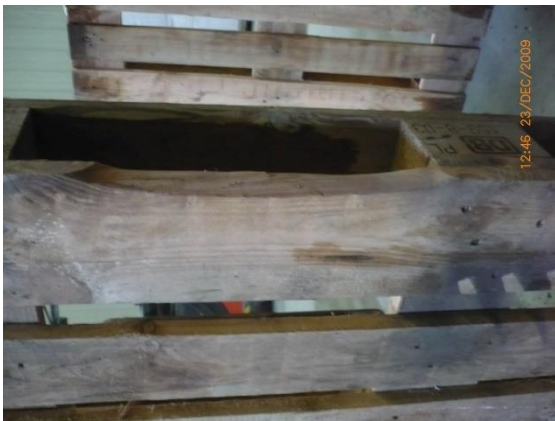
4.1 KÉP: Sérült fedlap